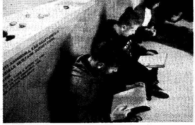
Gimnazistai išsilgine į edukacinę programą „Išsigelbėjęs Lietuvos žydų vaikas pasakoja apie ŠOA“.

Lietuvos Seimas 2020-uosius paskelbė Vilniaus Gaono ir Lietuvos žydų istorijos metais. Ta proga alytiškiai iš Putinų gimnazijos lankėsi Žydų muziejuje.