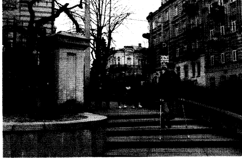
Tarp Gaono žydų ir Vinco Mykolaičio-Putino muziejų „pasiklydęs“ Redas Skidzevičius (IV c klasės mokinys).

Tam kambaryje gyvenantys vaikai buvo išmokyti net čiaudėti be garso, kojytės buvo apsuktos medžiaga, kad nesugirgždėtų grindys