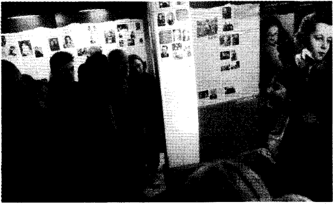
Prie Valstybinio Vilniaus Gaono žydų muziejaus stendų.