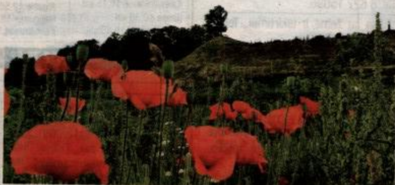
Papilės, vadinamasis Pirmasis piliakalnis, stūkso kairiajame Ventos upės krante.