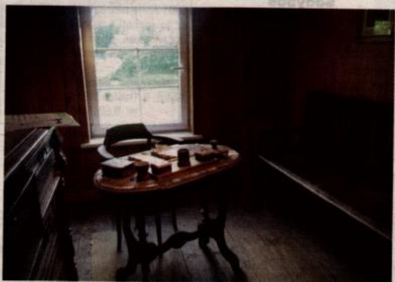
Ekspozicijoje poeto Vytauto Mačernio poezijos knygos, nuotraukos bei asmeniniai poeto daiktai.