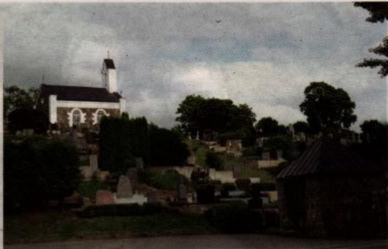
Gardų teritorija reljefiškai buvo labai panaši į Jeruzalę, tad kalvotoje vietovėje buvo nutarta lietuviams žemaičiams turėti savo Kristaus kančios kelią.