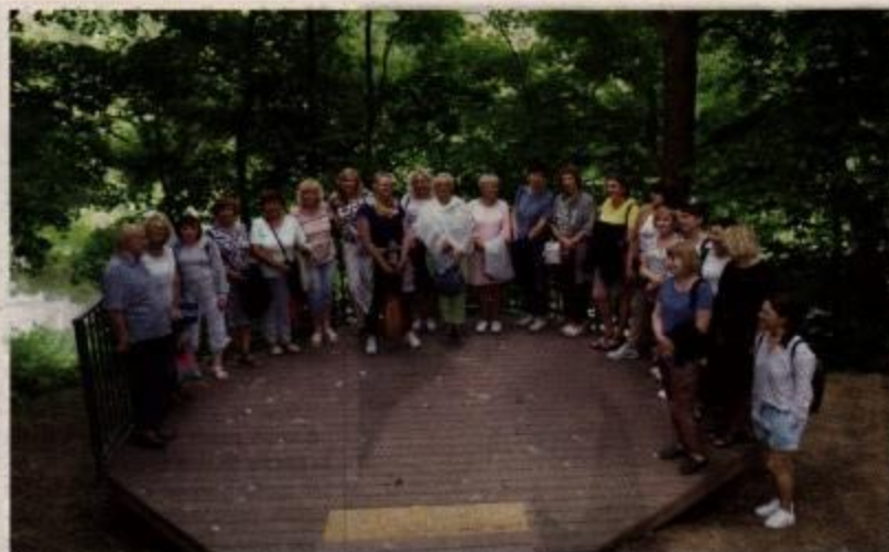
Keliautojai Lakštingalų slėnyje Ventos regioniniame parke.