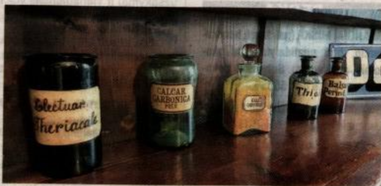
Viešnių miestelio senojoje vaistinėje.