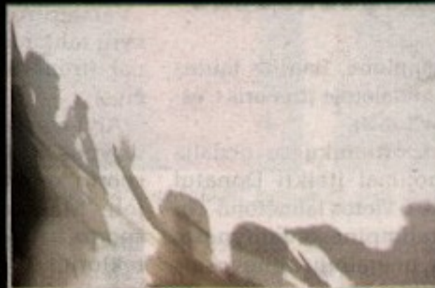
Iš šešėlių pasaulio grimasų.