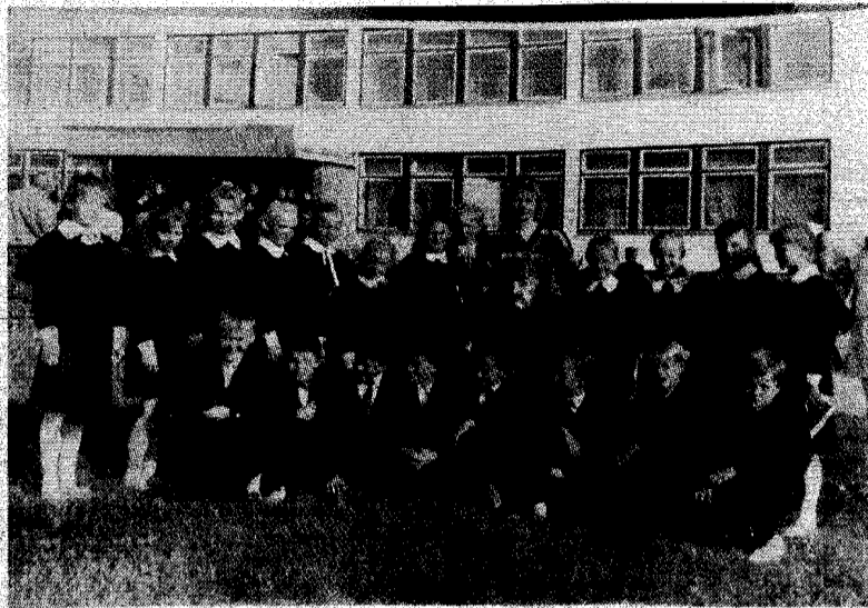
Buvę auklėtiniai 1990 m.