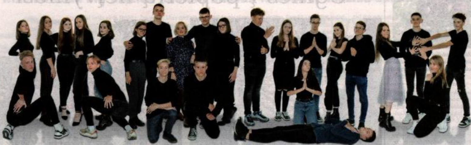
Mokinių taryba 2020-2021 m.m.