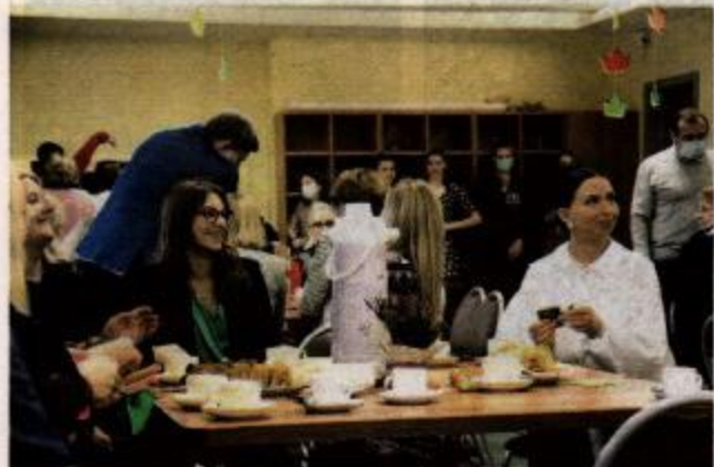
Mokytojų dienos renginyje.

Renginiai yra toks dalykas, kada niekada negali nuspėti, kaip bus, net jeigu turi ir tris planus, scenarijus. Čia reikia veikti greitai, protingai, nes visi laukia. Vieni renginiai būna geresni, kiti silpnesni, tačiau svarbiausia yra kiekvieno žmogaus nusiteikimas ir gera nuotaika!